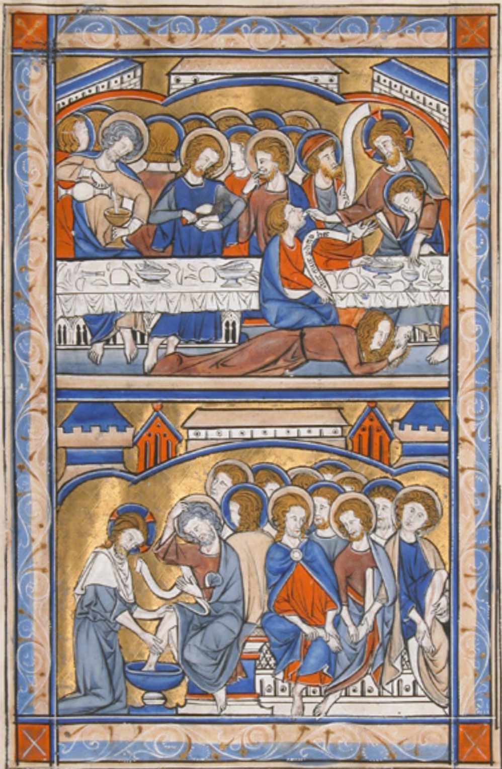
Fragment eines Psalteriums, Mitte 13. Jh.