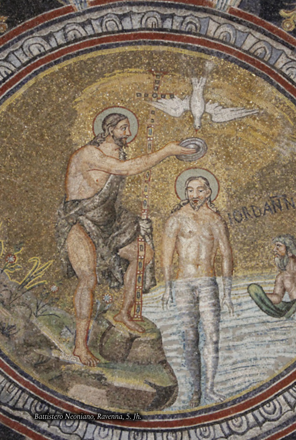
Battistero Neoniano, Ravenna, 5. Jh.