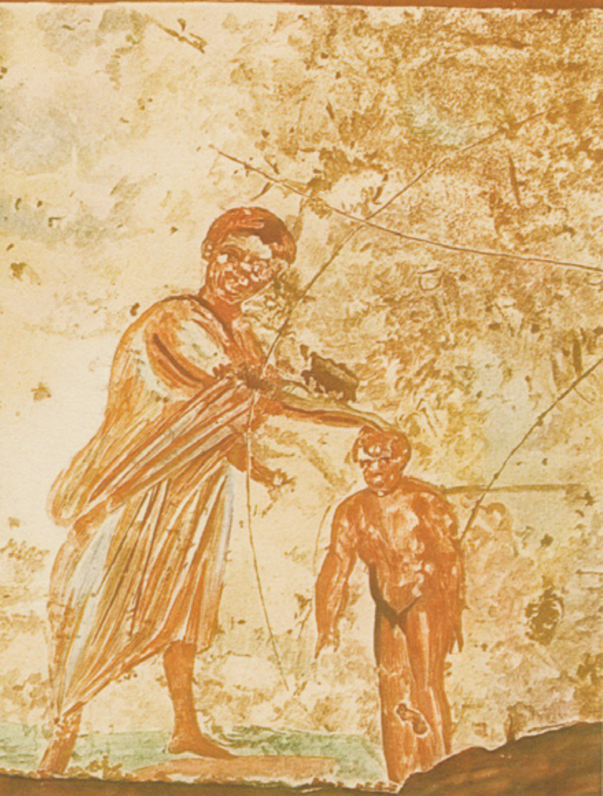
Calixtus-Katakombe, 2-3. Jh.