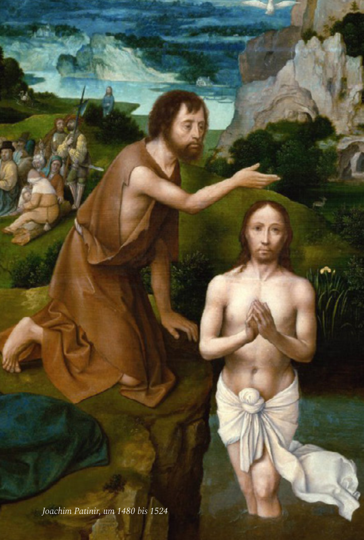
Joachim Patinir, um 1480 bis 1524